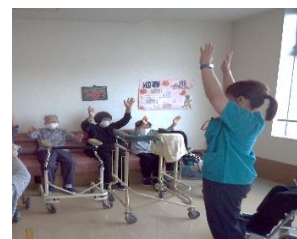
歯科衛生士と嚥下体操