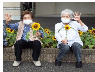
花壇に咲いたヒマワリ