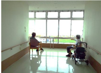
オーシャンビュー

「毎日見ても飽きないね～」と素晴らしい景色を楽しみながらお話が尽きないご様子です。